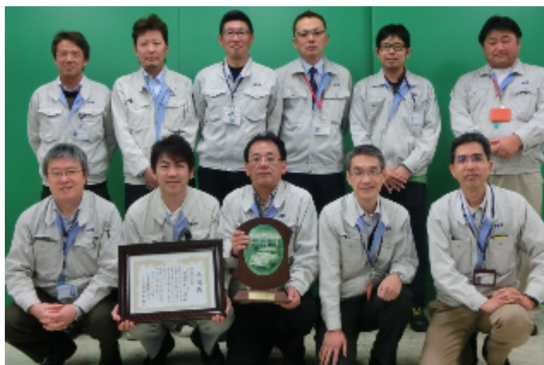
今回のプロジェクトに携った当社関係者の皆さん